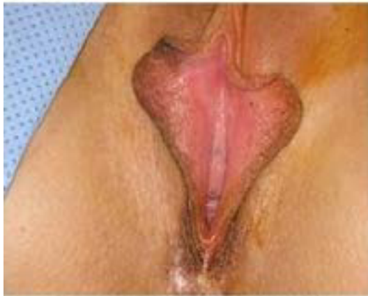
Figures 1a and 1b: Before surgery